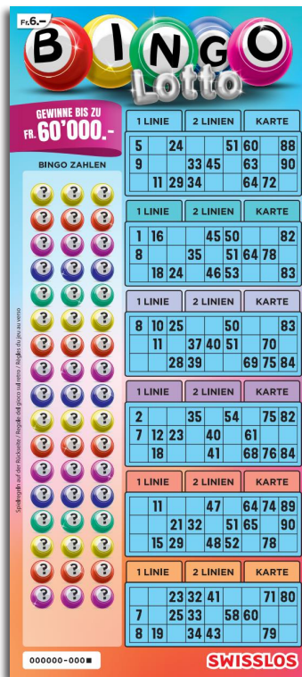
Beispiel: Gewinn Fr. 38.- (Fr. 8.- + Fr. 10.- + Fr. 20.- = Fr. 38.-)